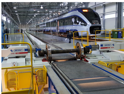
Fot. Tokarka model UGE 300 N.

14.04.2017 portal PolskiPrzemysl.com.pl : Tokarka RAFAMET w Mauretanii