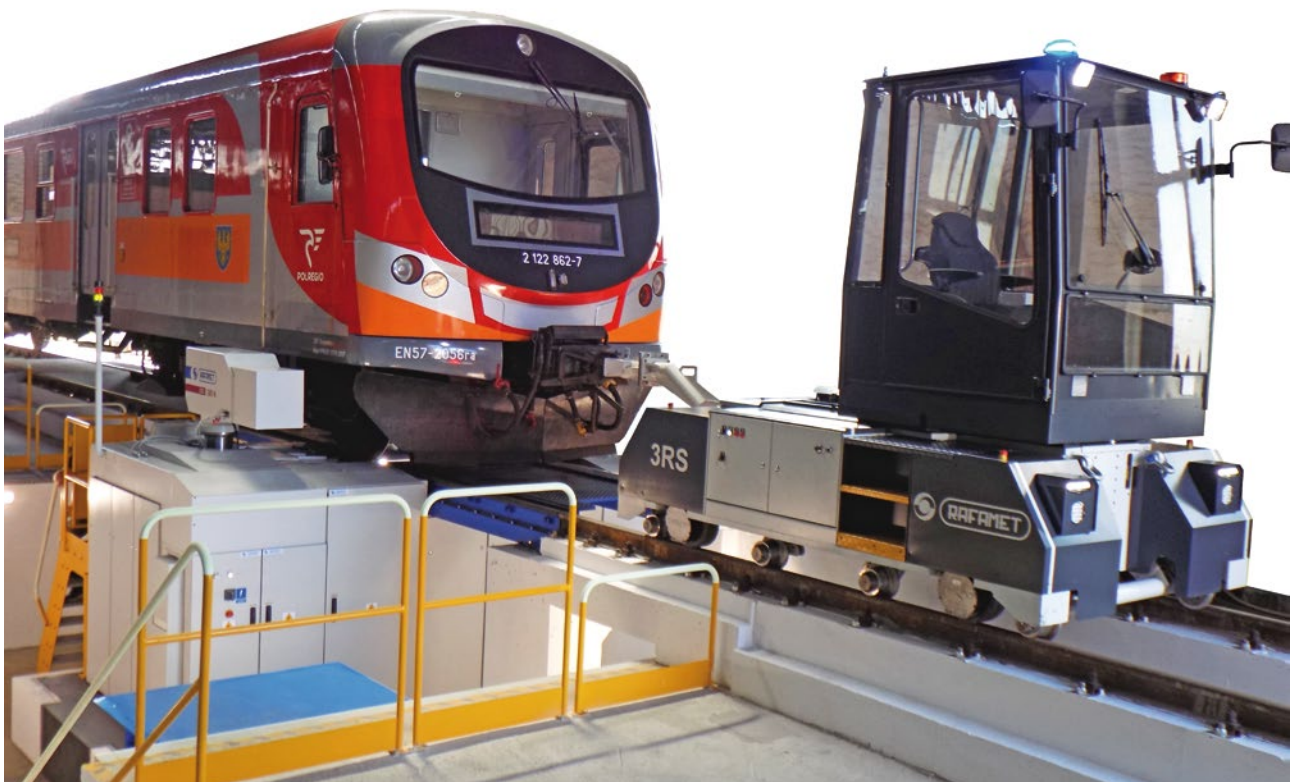
Wózek manewrowy 3RS wersji z kabiną operatora.